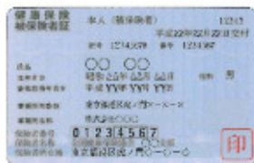
(例) 各種健康保険証