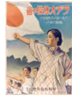
ラジオ体操の会のポスター(昭和6年)

1939(昭和14年) 国民体力の向上と国民精神の作興のため、大日本国民体操(初代ラジオ体操第三)を制定。