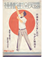
国民保健体操のポスター(昭和4年)

1928年(昭和3年)、逓信省簡易保険局(現在のかんぽ生命)が初代ラジオ体操を制定(当時は、国民保健体操という名称でした。)