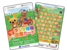
2021年度ラジオ体操出席カード(令和3年)

2018(平成30年) ラジオ体操制定90周年を記念しラジオ体操の日(11/1)制定。