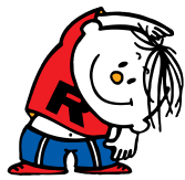
ラジオ体操イメージキャラクターラジオ体操坊や(通称:ラタ坊)

1978(昭和53年) ラジオ体操のイメージキャラクターラジオ体操坊やの誕生。特別巡回ラジオ体操会の開始。