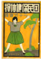
国民保健体操の解説(昭和8年)

1946(昭和21年) 初代ラジオ体操を中止し、舞踊体操とも呼ばれた2代目ラジオ体操(第一〜第三)を制定。