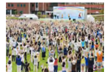
第56回1000万人ラジオ体操・みんなの体操祭(平成29年)