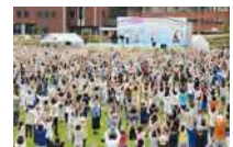
第56回1000万人ラジオ体操・みんなの体操祭(平成29年)