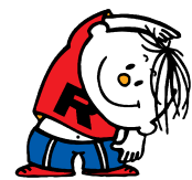
ラジオ体操イメージキャラクターラジオ体操坊や(通称:ラタ坊)