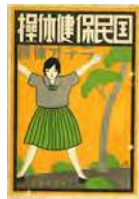
国民保健体操の解説(昭和8年)