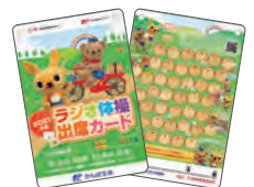
2021年度ラジオ体操出席カード(令和3年)