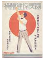
国民保健体操のポスター(昭和4年)

1928年(昭和3年)、逓信省簡易保険局(現在のかんぽ生命)が初代ラジオ体操を制定(当時は、国民保健体操という名称でした。)