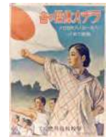
ラジオ体操の会のポスター(昭和6年)