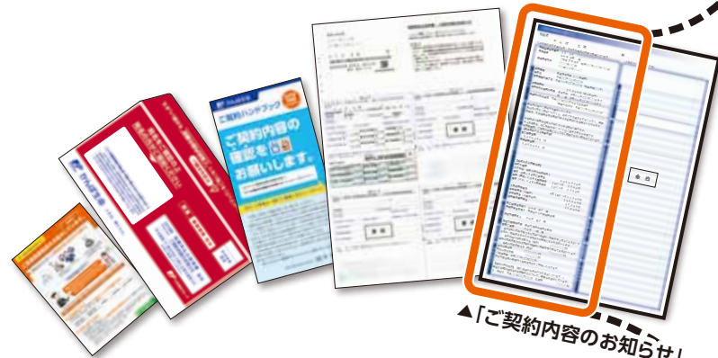
▲「ご契約内容のお知らせ」

保険契約者さまと被保険者さまが異なる場合は、 被保険者さまにもご確認いただいでください。