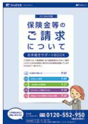
冊子「保険金等のご請求について」をご用意しております