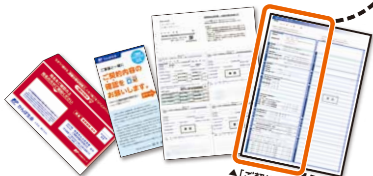
▲「ご契約内容のお知らせ」

保険契約者さまと被保険者さまが異なる場合は、 被保険者さまにもご確認いただいでください。